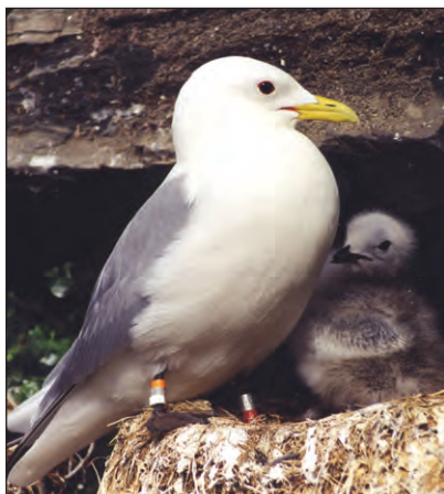
Krykkje (til venstre) og polarlomvi inngikk i prosjektet, men ble ikke like meget påvirket som de øvrige sjøfuglartene.