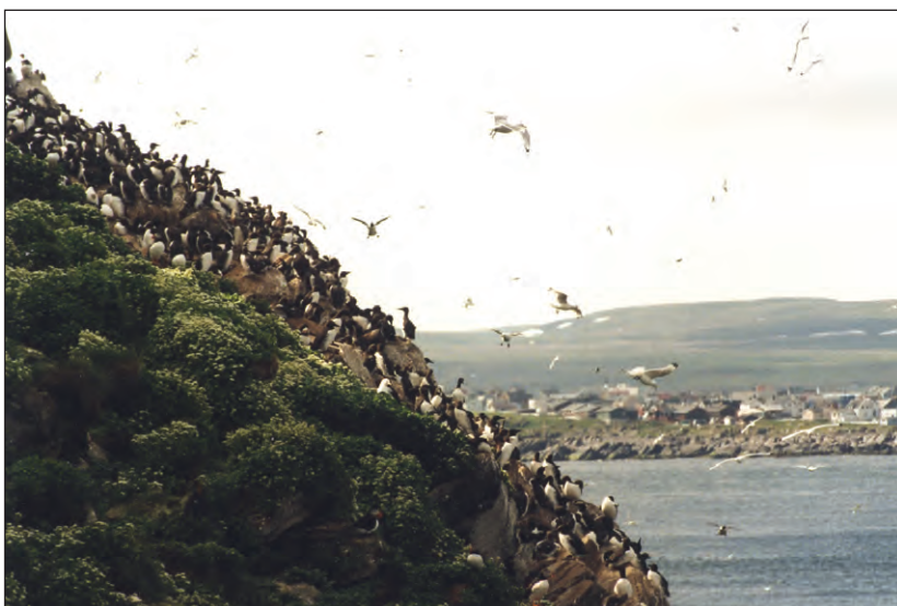
Lomvikoloni på Hornøya i Finnmark. Her ble undersøkelsen gjennomført. Vardø i bakgrunnen.

Det er ikke varmere sjøvann i seg selv som dreper sjøfuglene, men mangelen på mat. Når lodde og sildefisken tobis ikke tåler at vannet blir varmere, blir det mindre å leve av for sjøfuglene. Ingen ting tyder på at det blir bedre i tiden fremover.